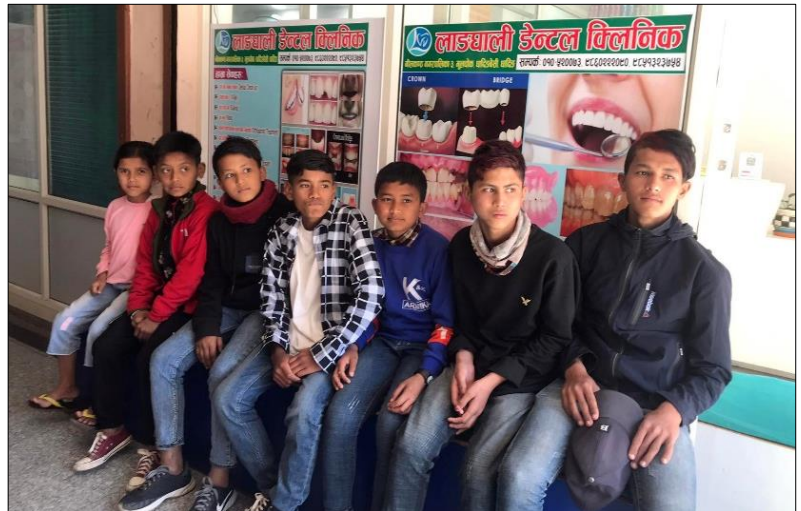
Lite nervöst var det nog i väntrummet utanför kliniken

Tack alla ni som hjälper oss att fortsätta detta projekt genom era bidrag. Vi hoppas kunna hitta fler sponsorer som Växjö Rotaryklubb och Leon Anderssons tandläkarmottagning, som i år finansierade nästan hela utflykten till tandklinikerna i Dhading.